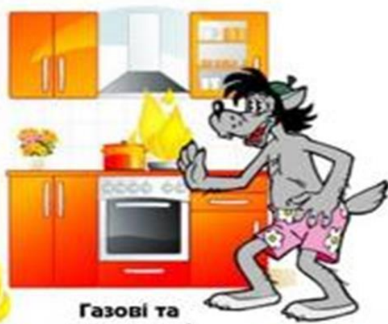
Газові та електричні печі