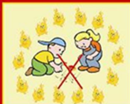
Не грай з сірниками