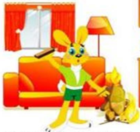
Необережне поводження з вогнем