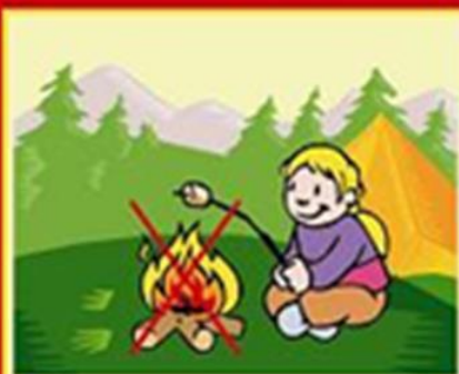
Бережи природу від вогню