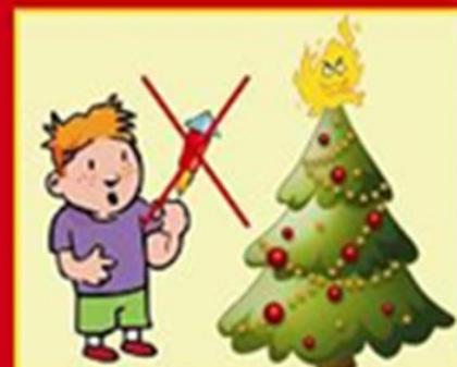
Їйверки - небезпечні іграшки