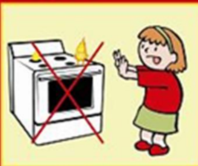
Будь обережний з плитою