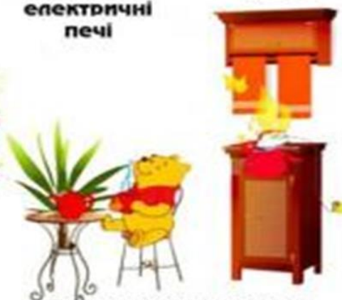
Запущені без нагляду електроприлади

Не вмикай на кухні газ – РАЗ, Не клади в запіч дрова – ДВА, В лісі сірників не три – ТРИ, Не лишай вогонь в квартирі – ЧОТИРИ, Не лягай при свічці спать - П'ЯТЬ, Іскра впала на підлогу – погасить – ШІСТЬ, Зачиніть вікно, коли в небі грім – СІМ, У грозу під деревом не стій у лісі – ВІСІМ, Сірником не забавляйтесь – ДЕВ'ЯТЬ, Пам'ятайте всі, про що в лічилці йдеться – ДЕСЯТЬ.