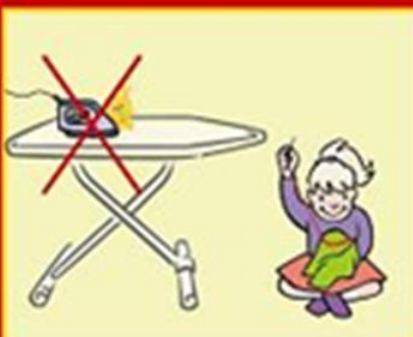
Не залишай праску увімкненою