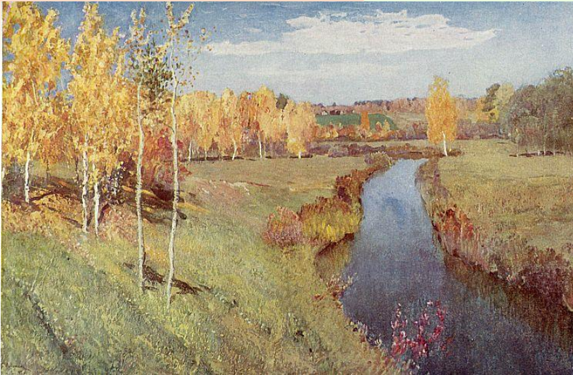
І. Левітан «Золота осінь»