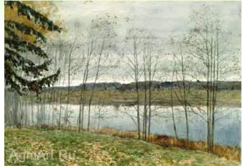
І. Левітан «Осінь»

На початку дітям пропонуються для порівняння картини різних художників одного жанру, які відображають контрастний настрій. А потім картини одного автора, але різного колористичного рішення.