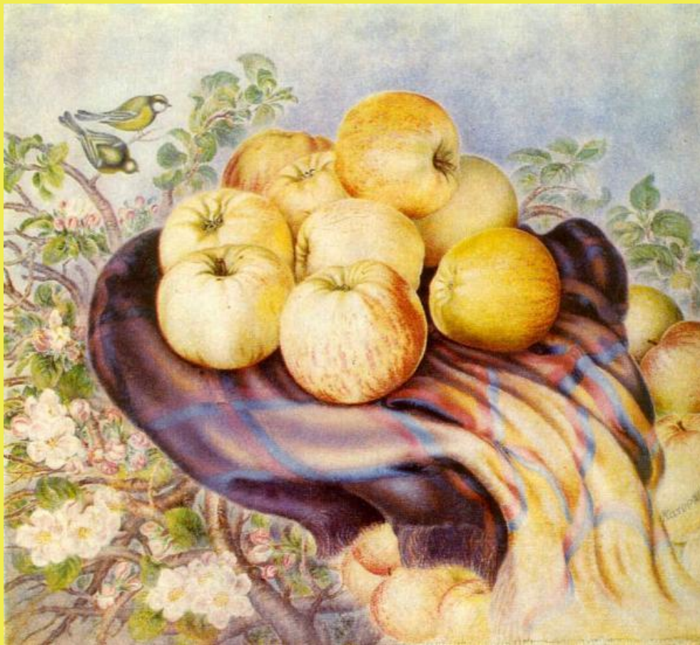
К. Білокур «Натюрморт»

Доберіть необхідні слова до поданої картини: